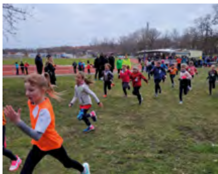
Mädchen der Altersklasse W9